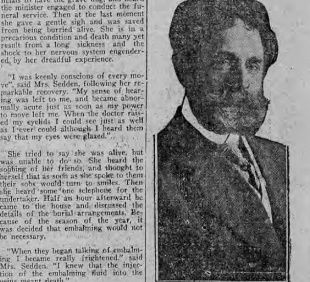
SENATOR J. HAMILTON LEWIS

SPRINGFIELD, Ill.—United States Senator James Hamilton Lewis, who is in the city to confer with Governor Dunning, was taken seriously ill at the executive mansion. The attending physician pronounced the case one of acute indigestion and forbade his patient to do any work for several days. An engagement to speak at a Democratic banquet at St. Louis was canceled.